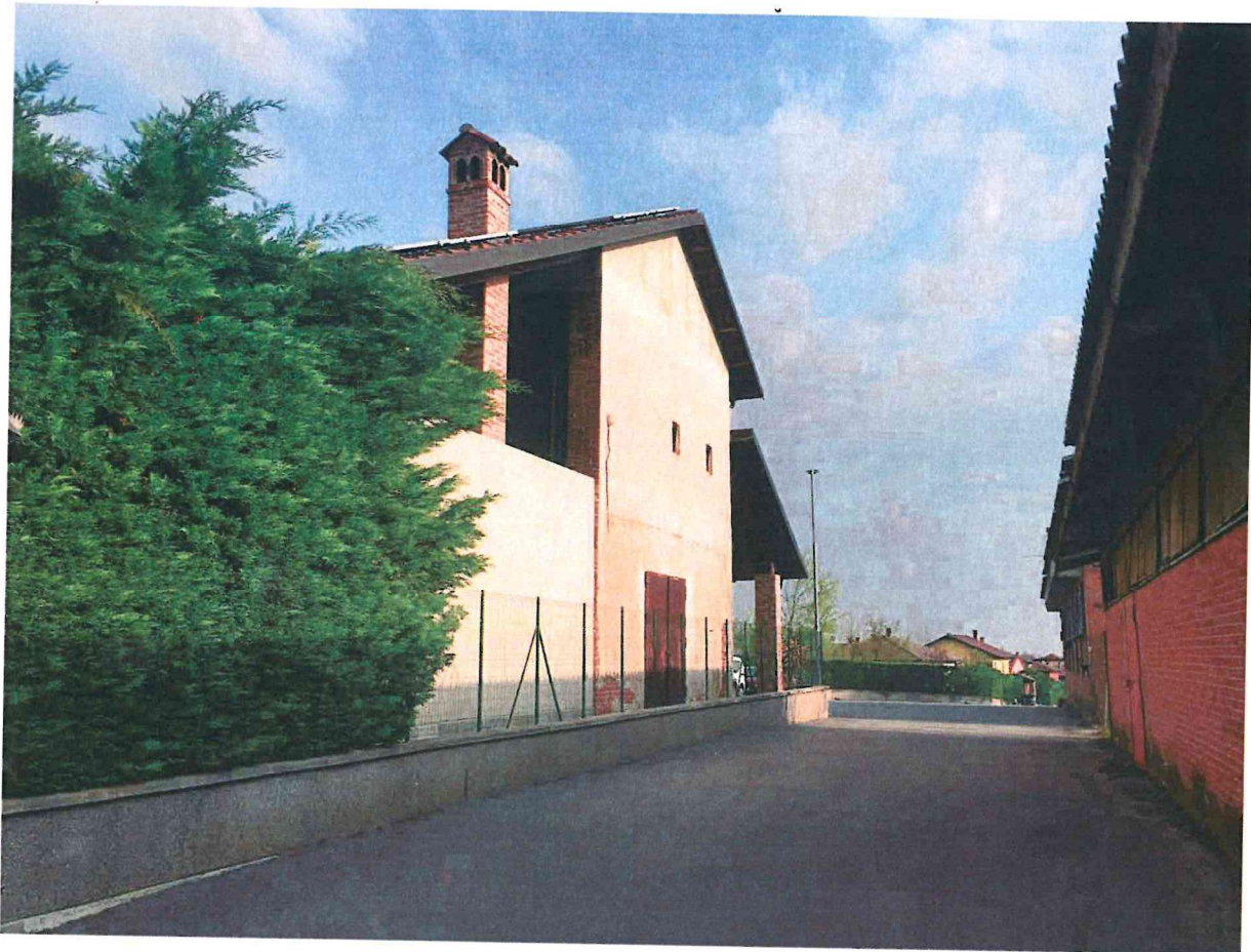
Immagine 03 – Vista da Via del Castello