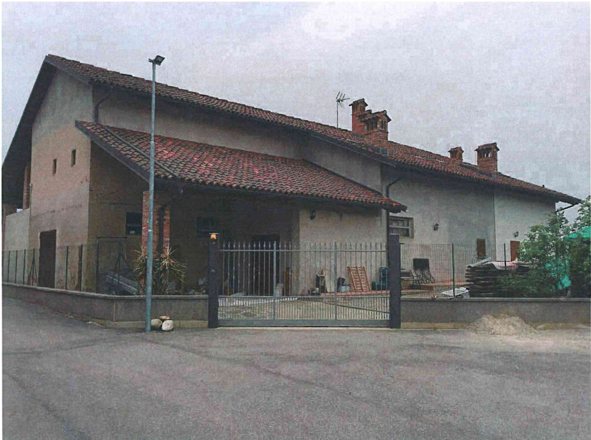
Immagine 02 – Vista da Via del Castello