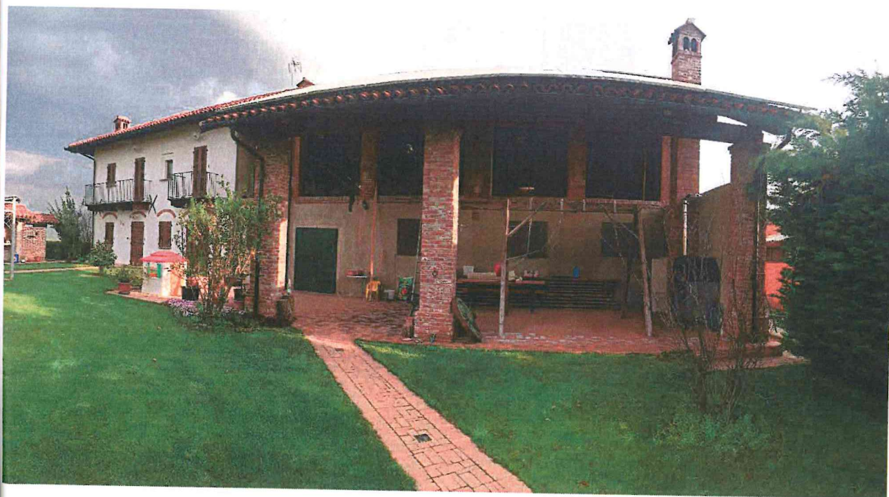
Immagine 04 – Vista interna