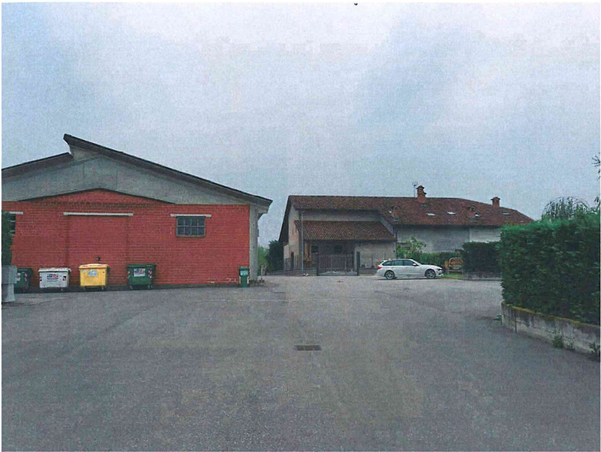
Immagine 01 – Vista da Via del Castello