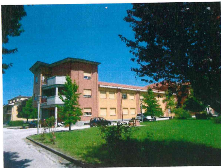
Vista immobile in oggetto