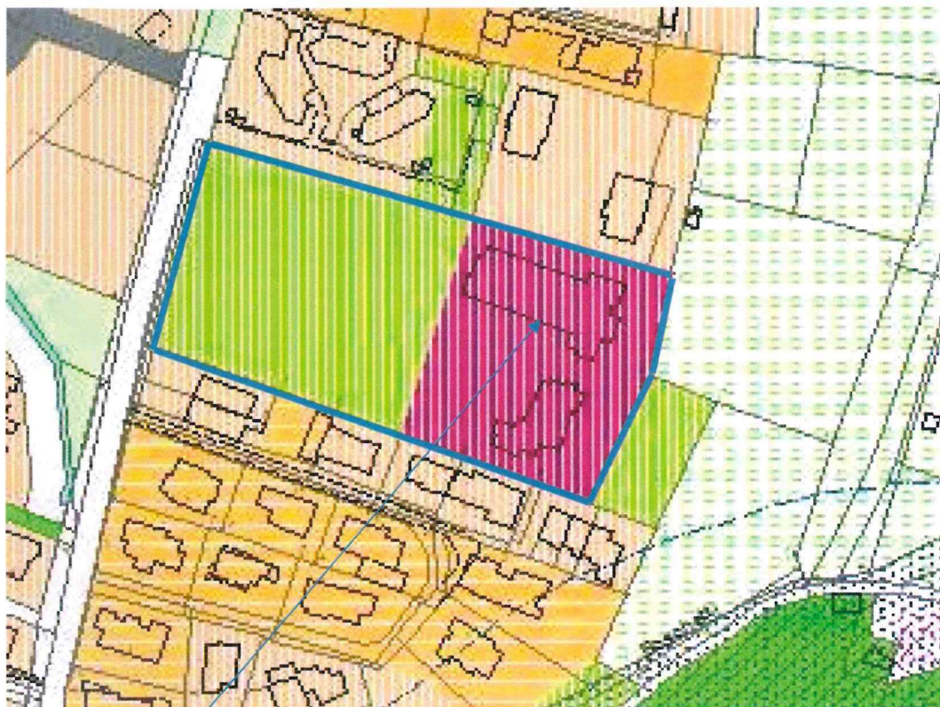
Porzione di terreno richiesta