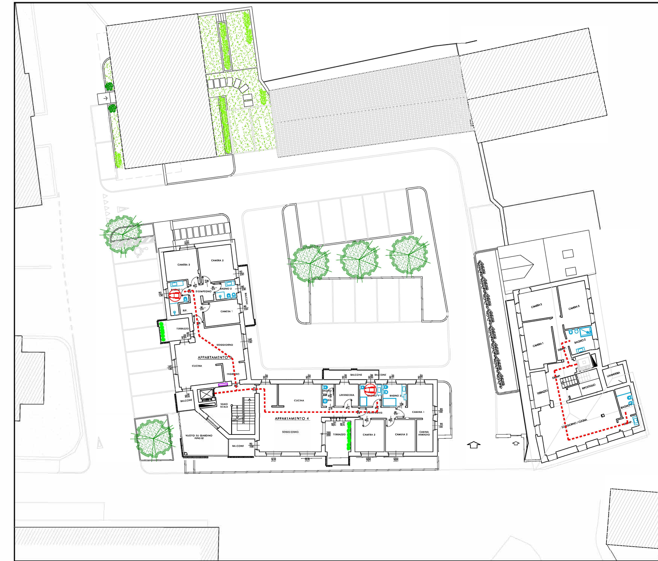
PLANIMETRIA DEL LOTTO SCALA 1 : 250 - PIANO SECONDO/TERZO DEI PERCORSI PER SUPERAMENTO BARRIERE ARCHITETTONICHE