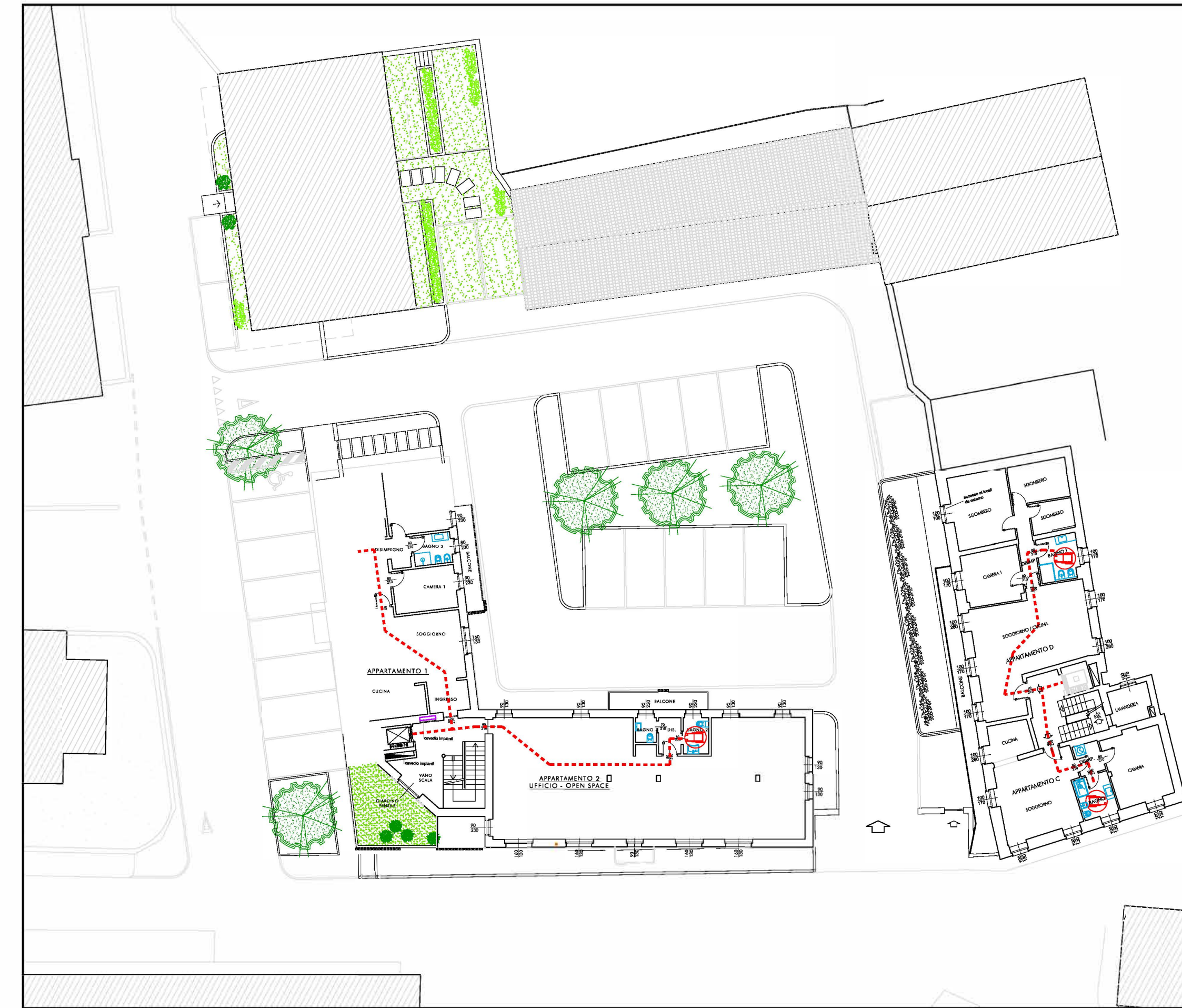
PLANIMETRIA DEL LOTTO SCALA 1 : 250 - PIANO PRIMO DEI PERCORSI PER SUPERAMENTO BARRIERE ARCHITETTONICHE