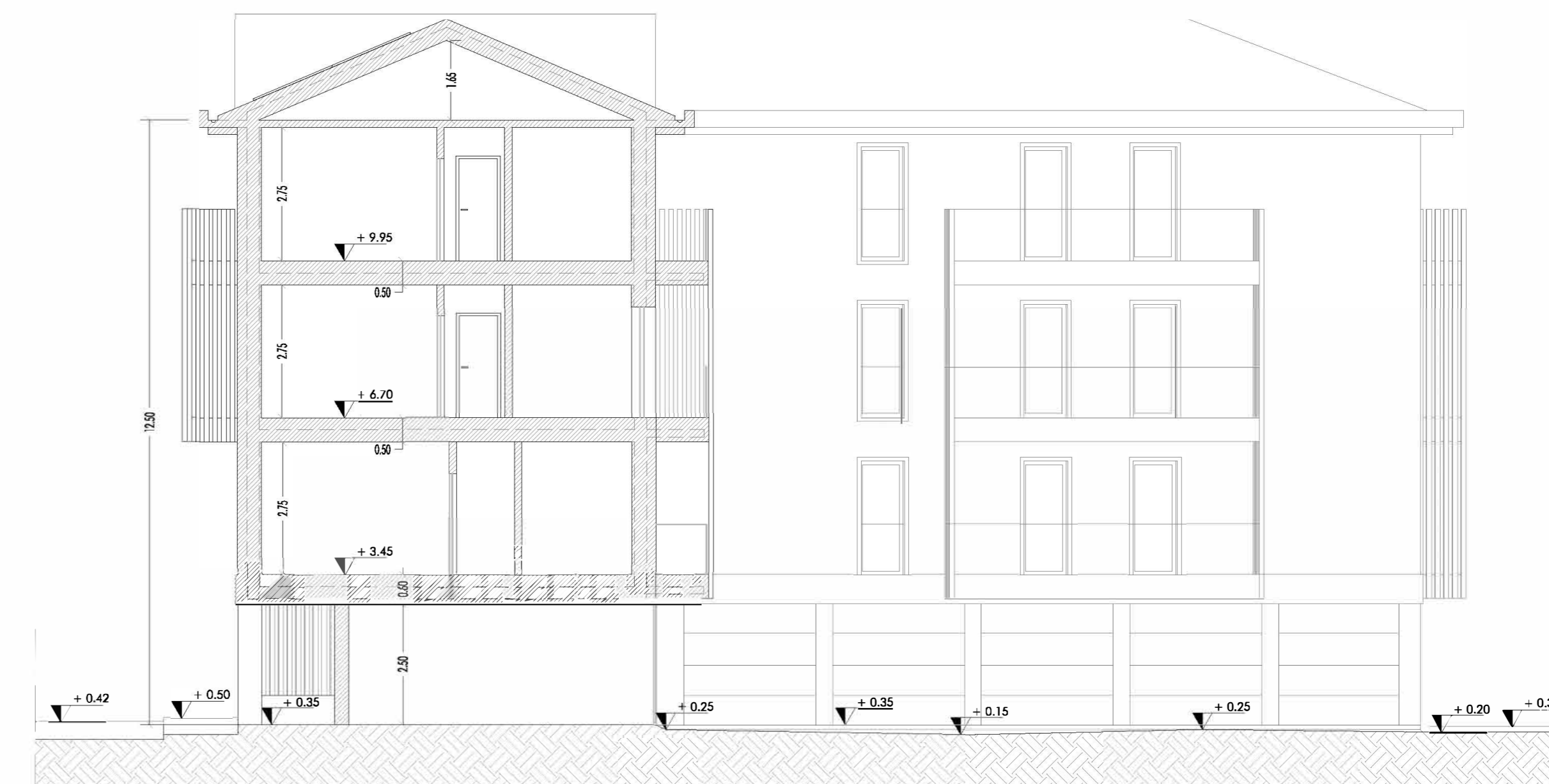
FABBRICATO PRINCIPALE - SEZIONE A - A'