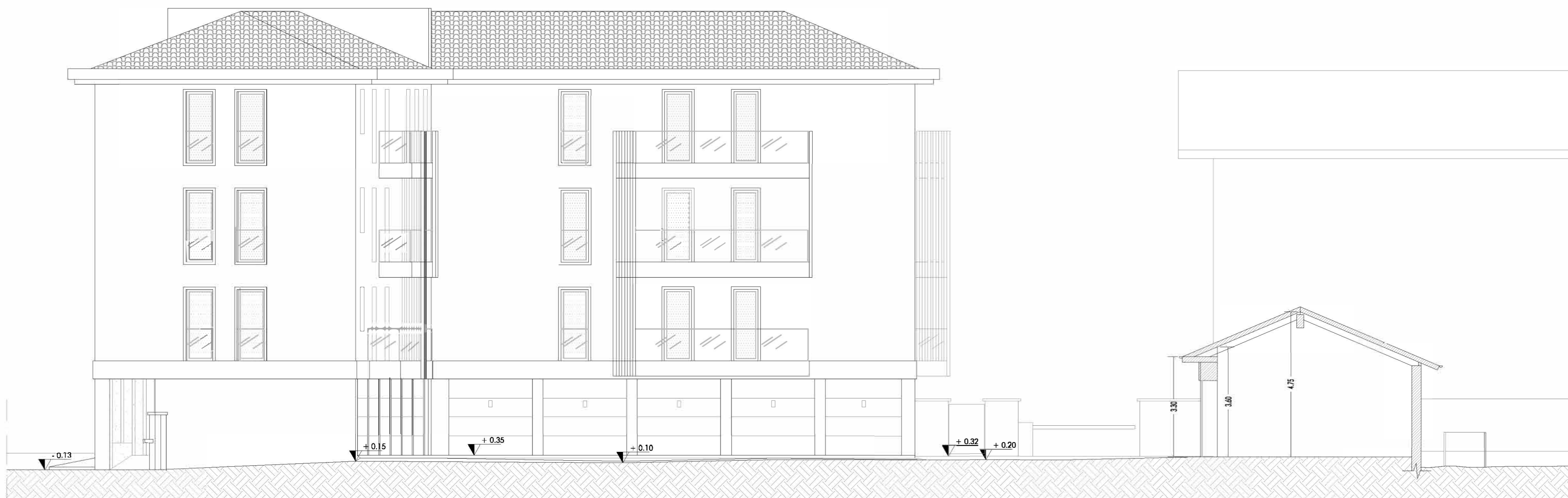
PROSPETTO EST - SEZIONE A - A'