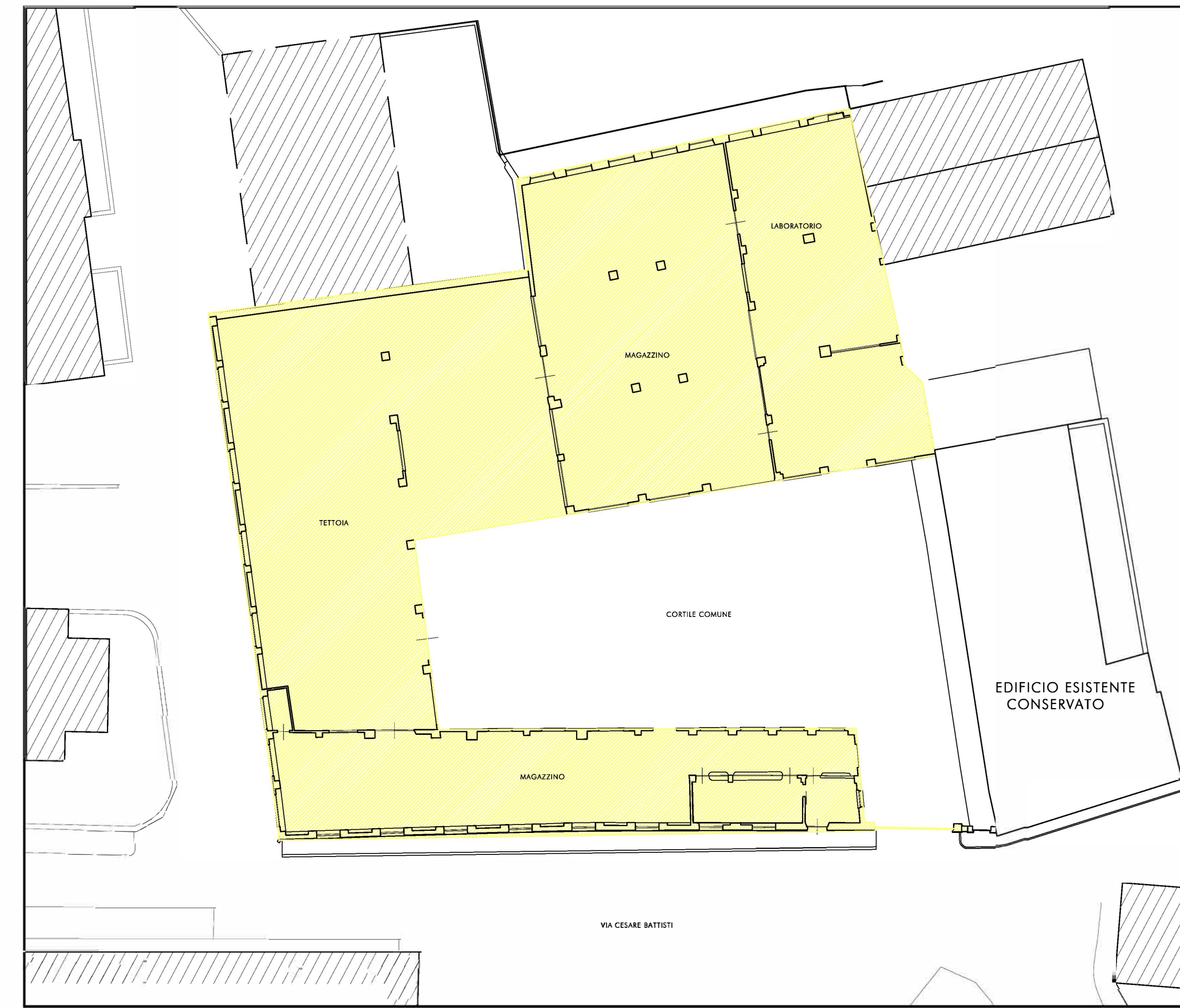
PLANIMETRIA DEL LOTTO SCALA 1 : 250 - DEMOLIZIONI

Il presente elaborato è di proprietà dei progettisti ed è protetto a termini di legge