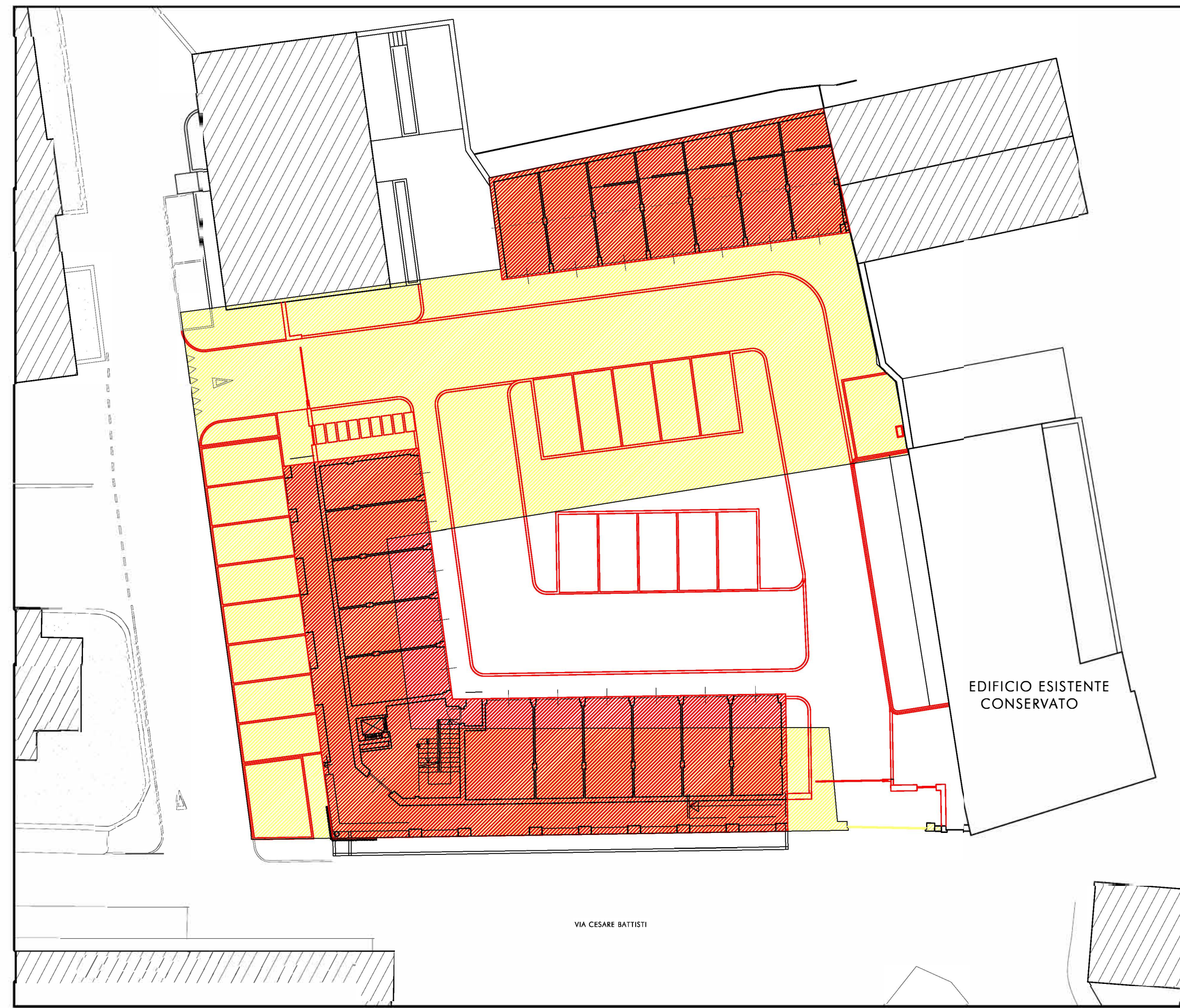
PLANIMETRIA DEL LOTTO SCALA 1 : 250 - COMPARATIVA DEMOLIZIONI E NUOVE COSTRUZIONI