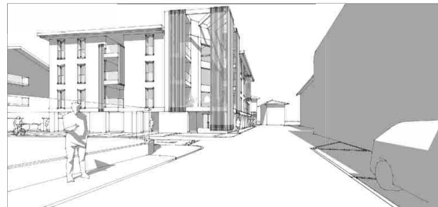
SCHIZZO PROSPETTICO - VISTA DEL COMPARTO DA VIA CESARE BATTISTI LATO OVEST.

Struttura in travi di ferro a sbalzo per reggere facciata in Brise soleil