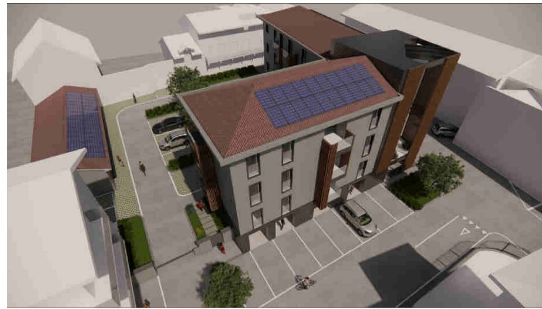
VISTA 4 - VEDUTA AEREA DEL COMPARTO VISTO DA OVEST.