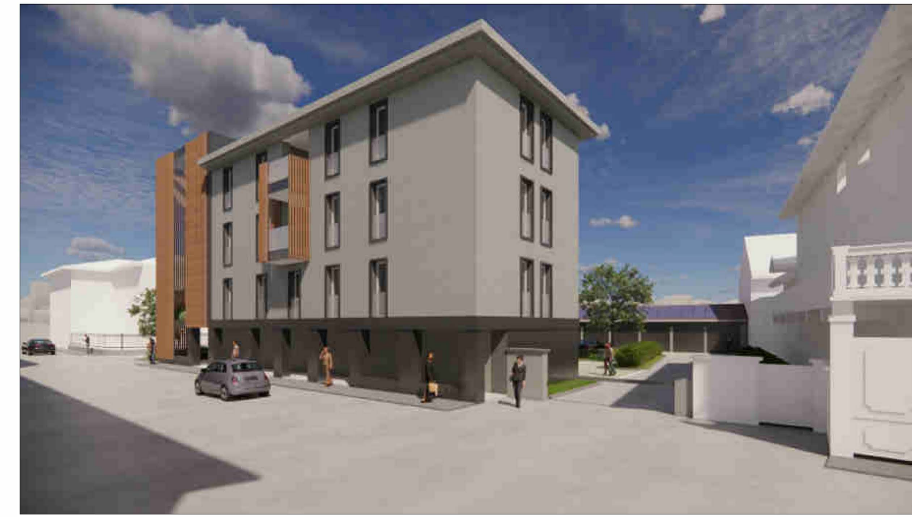
VISTA 2 - VISTA DEL COMPARTO DA PIAZZA ROMANISIO - LATO SUD.