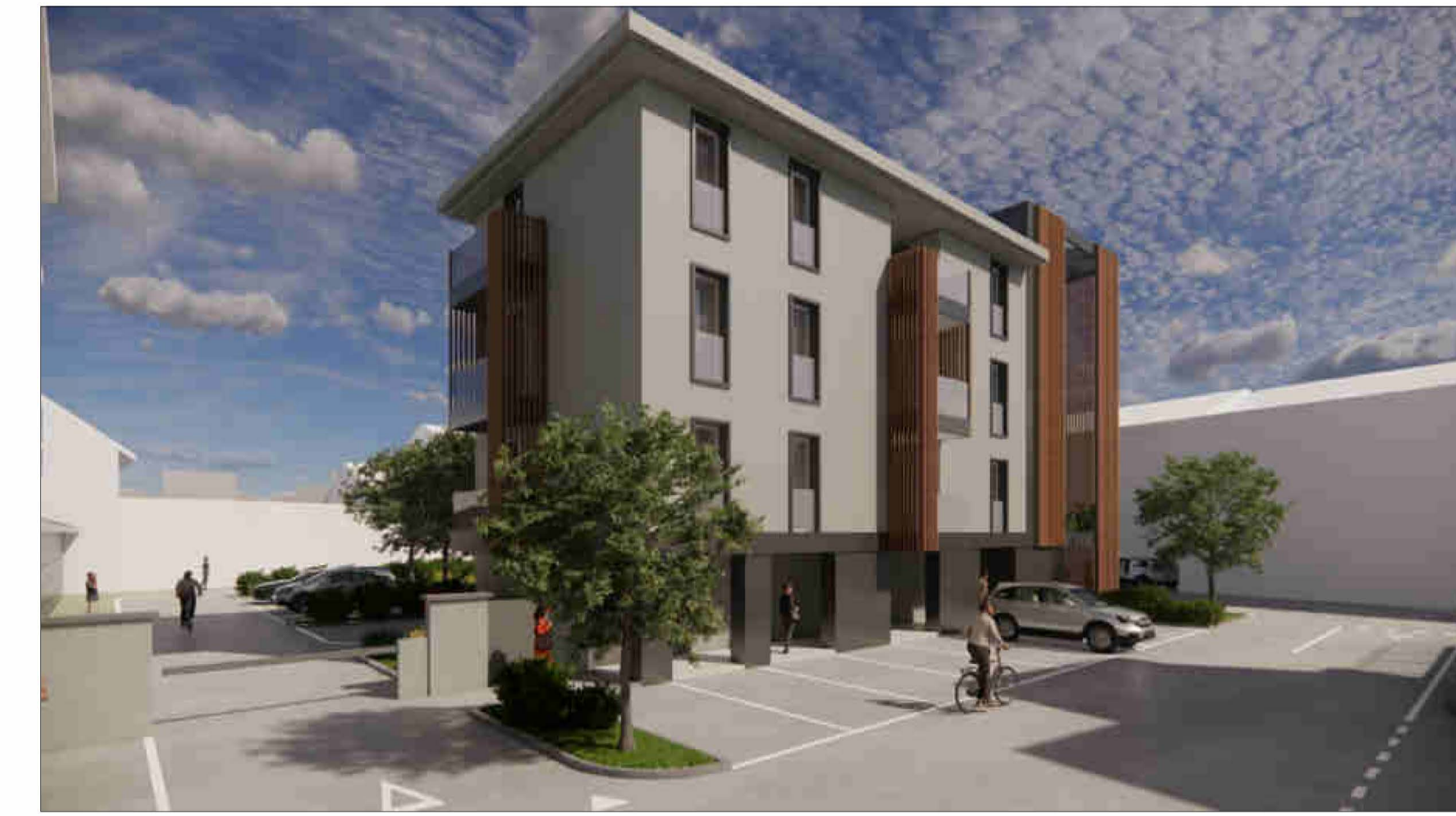
VISTA 3 - VISTA DEL COMPARTO DA STRADA LATERALE A VIA CESARE BATTISTI - LATO NORD.