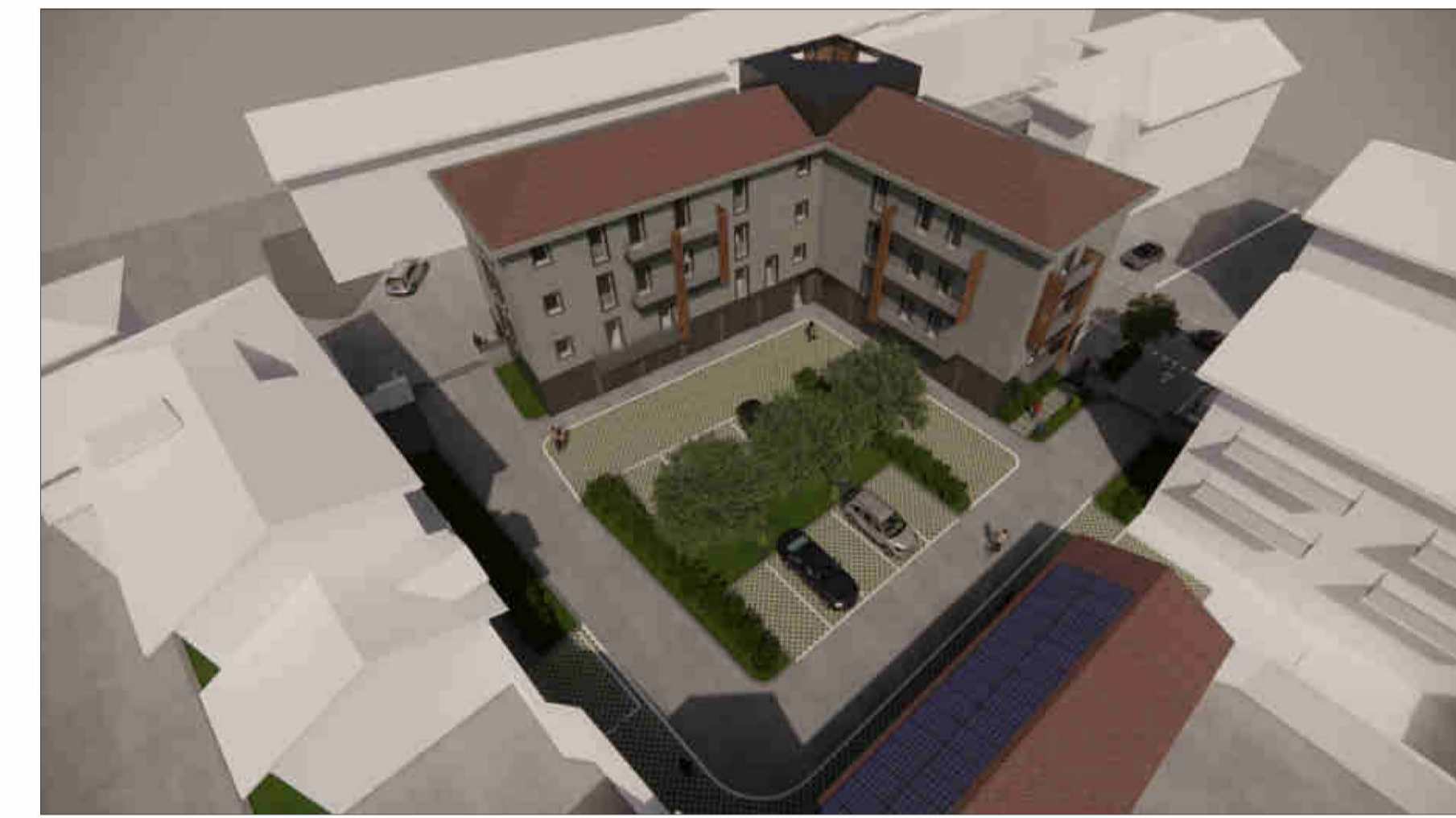
VISTA 5 - VEDUTA AEREA DEL COMPARTO VISTO DA NORD.