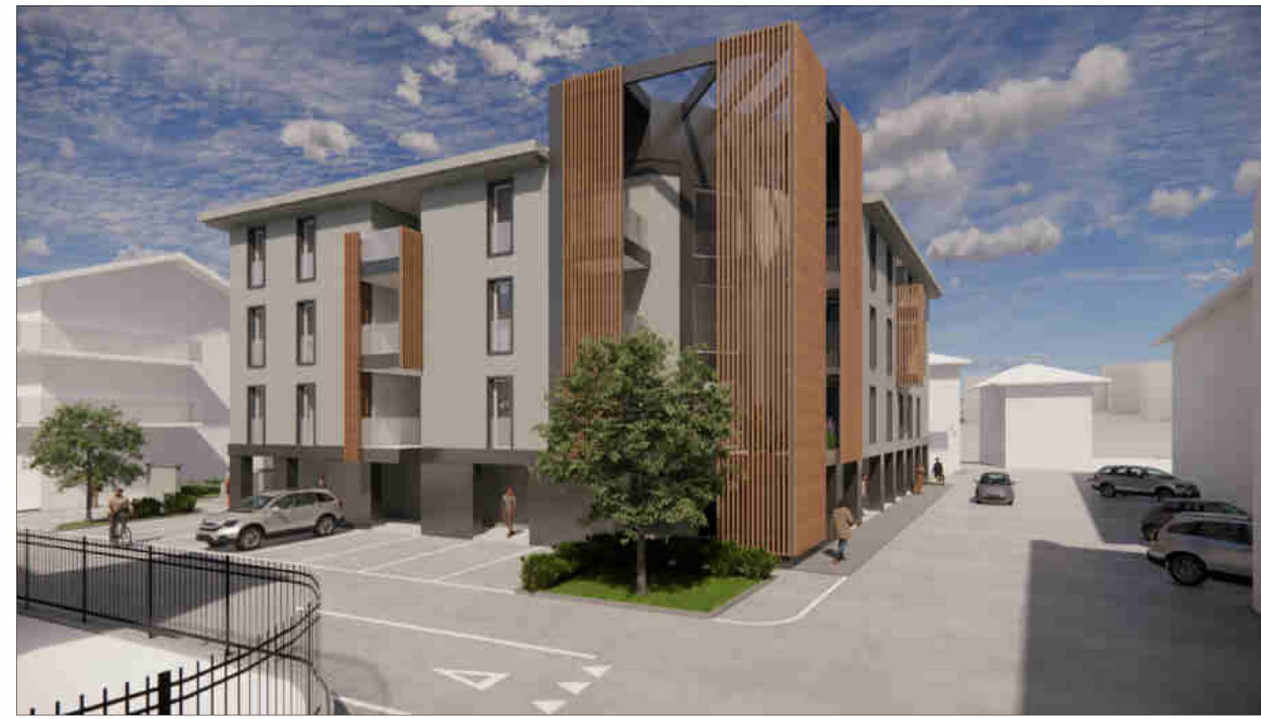
VISTA 1 - VISTA DEL COMPARTO DA VIA CESARE BATTISTI LATO OVEST.

Il presente elaborato è di proprietà dei progettisti ed è protetto a termini di legge