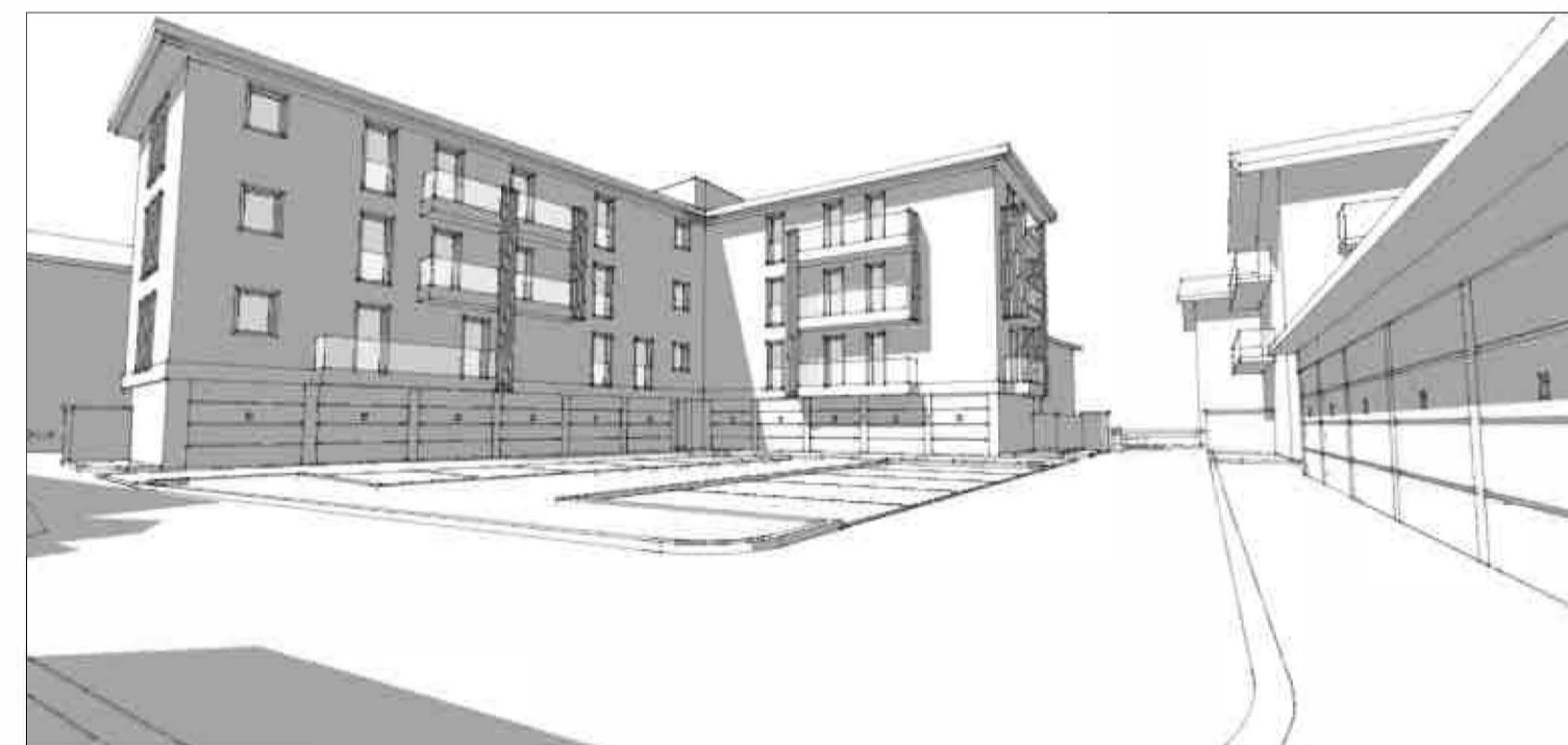
SCHIZZO PROSPETTICO - VISTA DEL COMPARTO DAL CORTILE INTERNO.