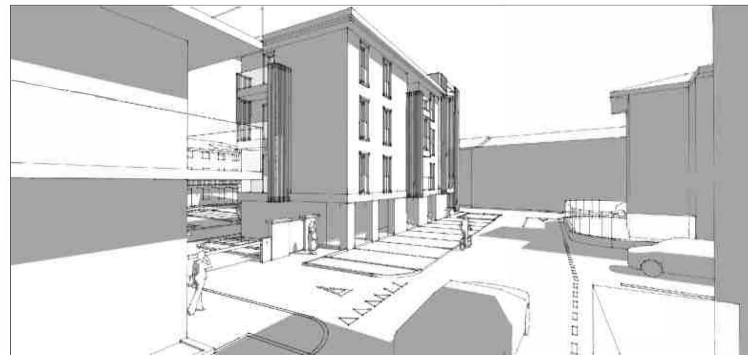
SCHIZZO PROSPETTICO - VISTA DEL COMPARTO DA VIA CESARE BATTISTI LATO NORD.