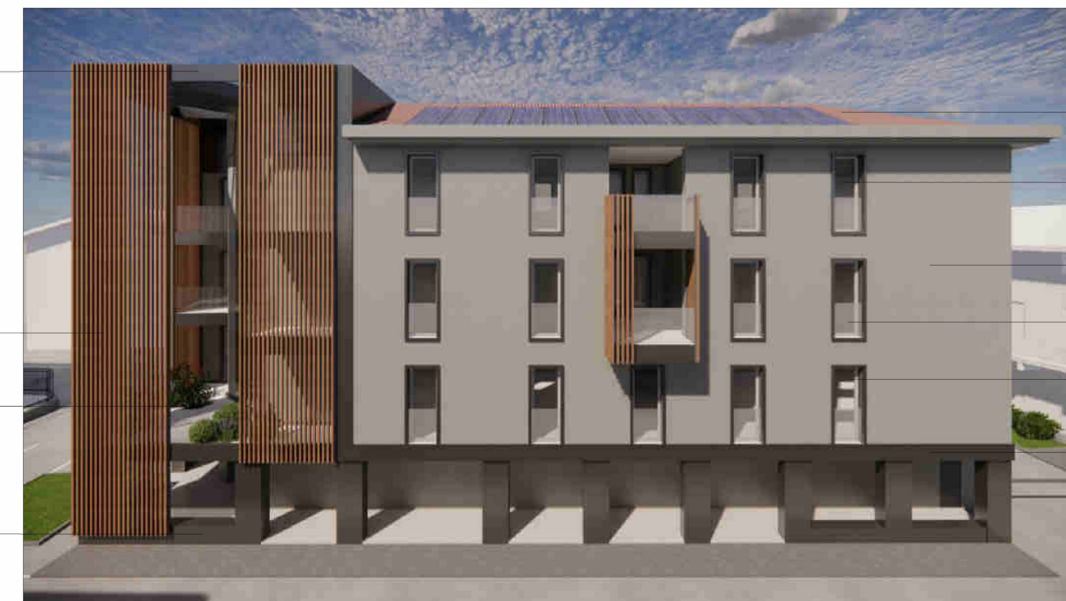
PROSPETTO SUD CON INDICAZIONE DEI MATERIALI E DELLE FINITURE

Rivestimento in marmo a piastrelle di gres porcellanato