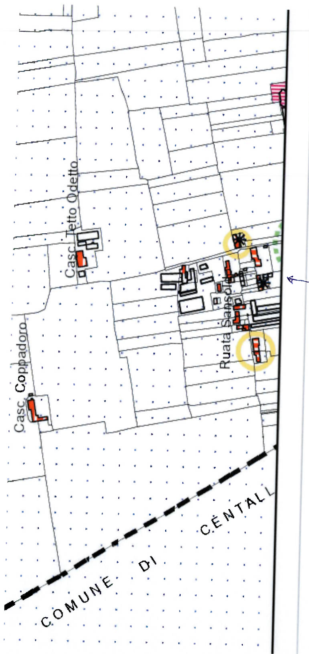
TAVOLA 1B PREC