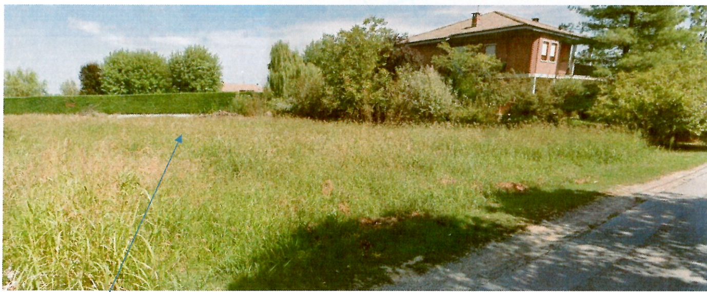
Vista proprietà da Strada della Creusa