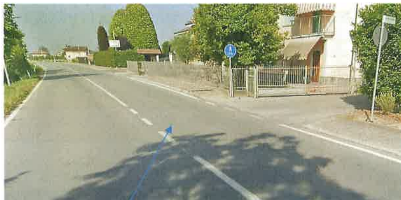
Vista ubicazione rotonda verso Cuneo