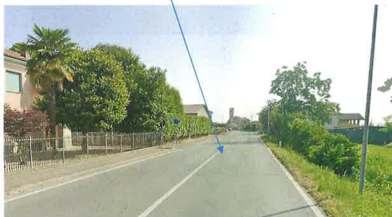
Vista ubicazione rotonda verso Fossano