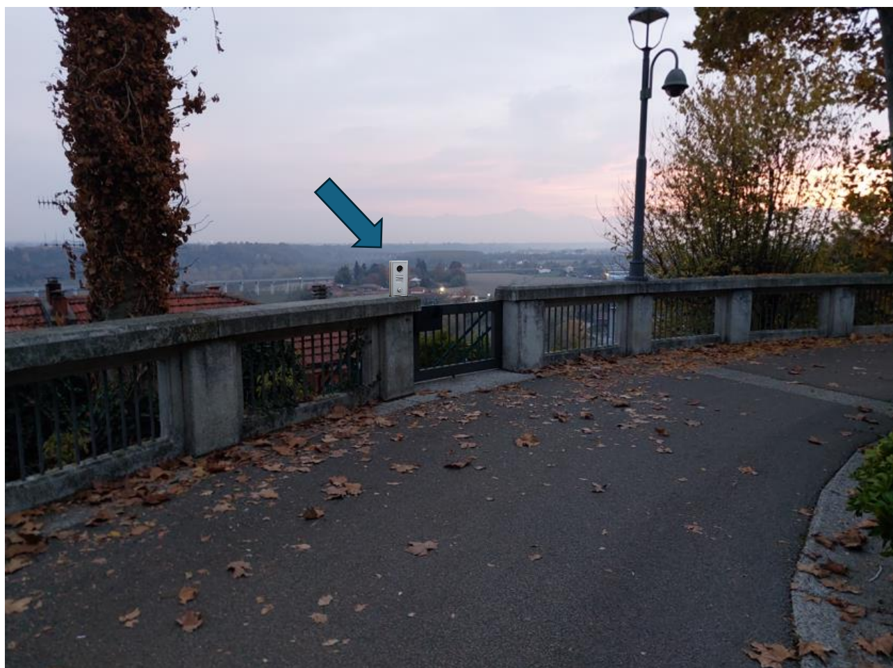
Foto 1 - Rendering con citofono