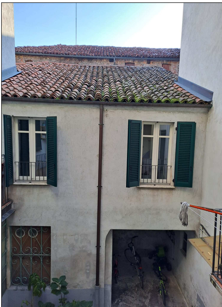
Foto 1 - Vista dal piano primo, da Ovest