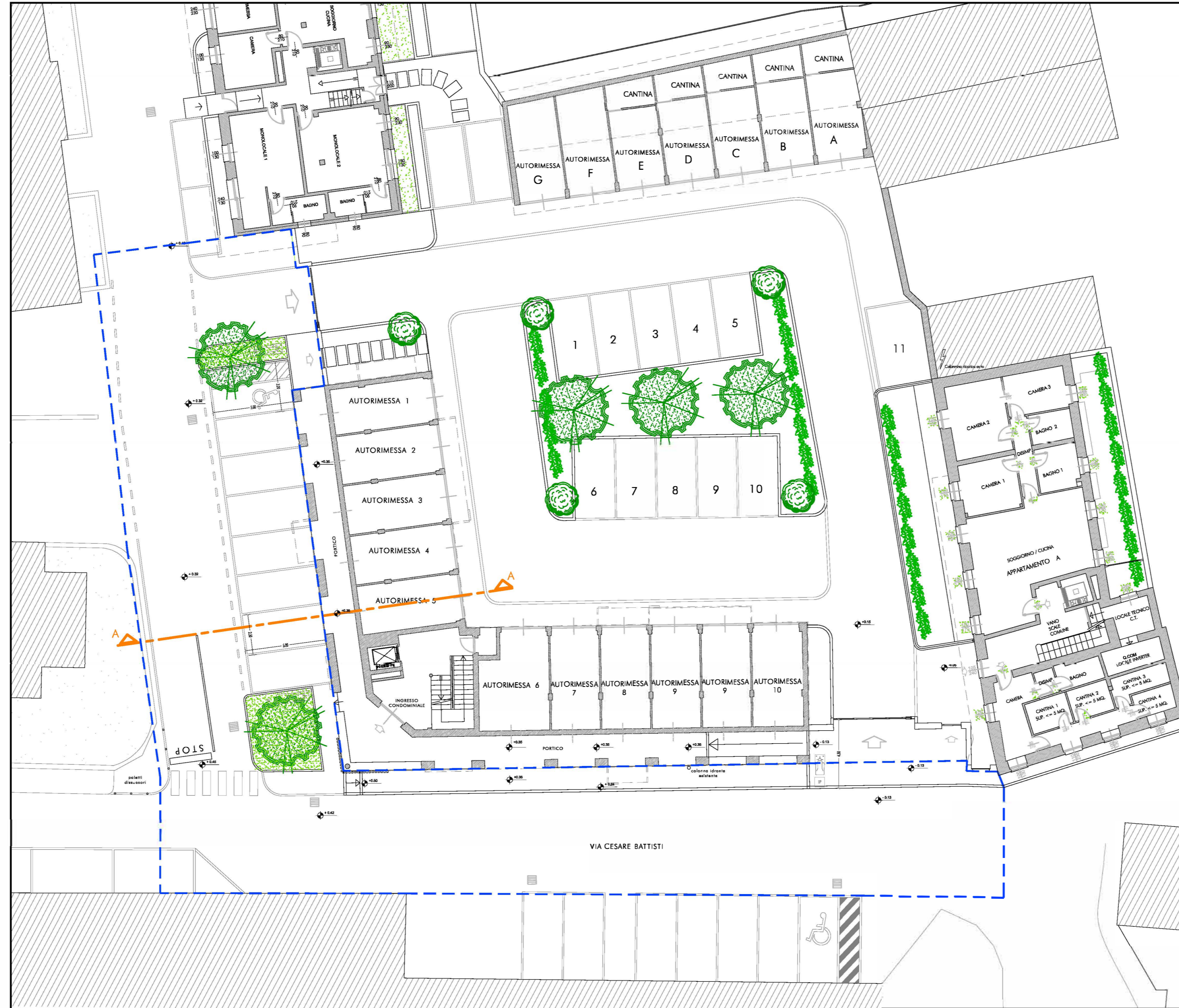
PROGETTO OPERE DI URBANIZZAZIONE SU STRADA PUBBLICA E SULLA PARTE IN CESSIONE

Il presente elaborato è di proprietà dei progettisti ed è protetto a termini di legge