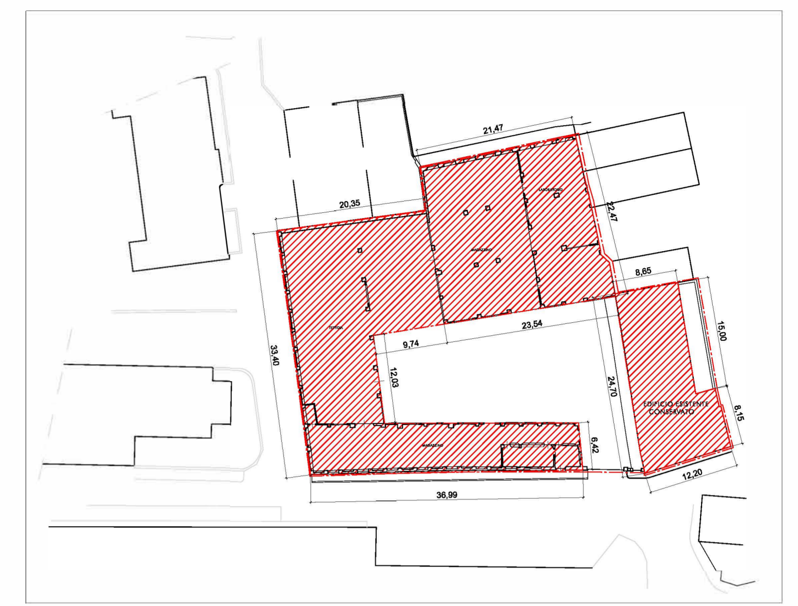
PLANIMETRIA GENERALE STATO DI FATTO DEL LOTTO - SCALA 1 : 500 -

/// SUPERFICIE COPERTA STATO DI FATTO - R/C 1417 MQ / 2004 MQ = 0,7