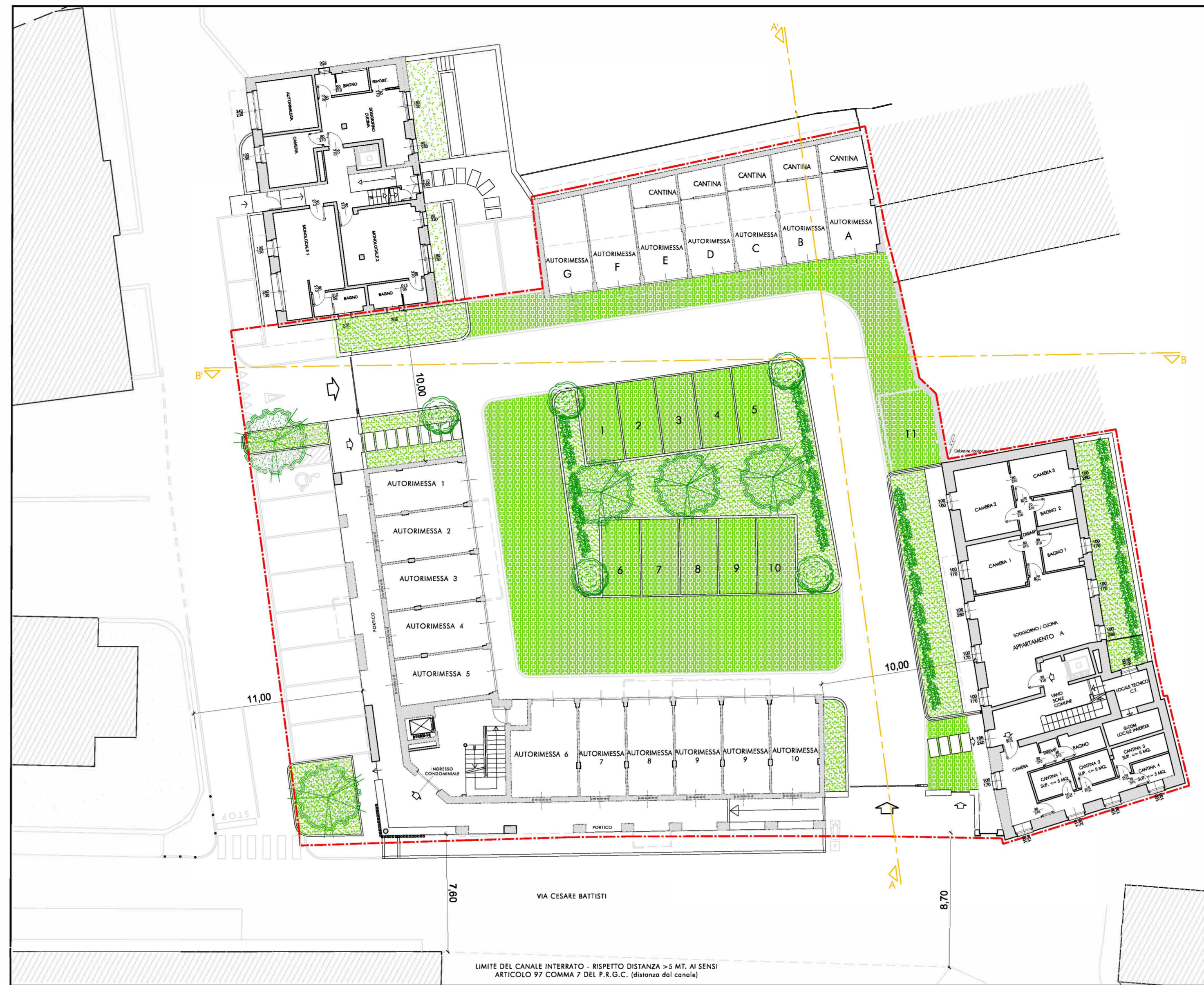
PLANIMETRIA GENERALE DI PROGETTO DEL LOTTO - SCALA 1 : 200 -

Il presente elaborato è di proprietà dei progettisti ed è protetto a termini di legge