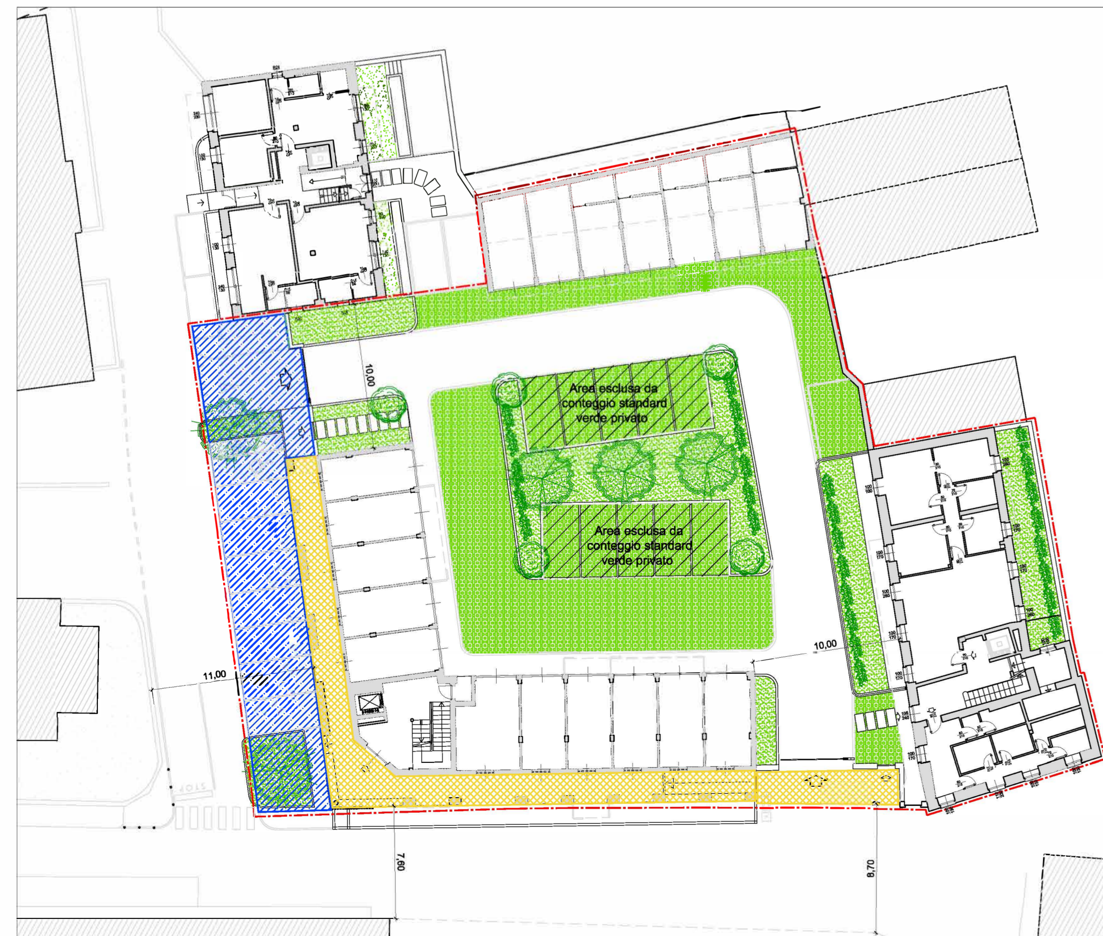
PLANIMETRIA GENERALE DI PROGETTO DEL LOTTO - SCALA 1 : 250 -

/// SUPERFICIE COPERTA IN PROGETTO - R/C 785 MQ. / 2004 MQ. = 0,39