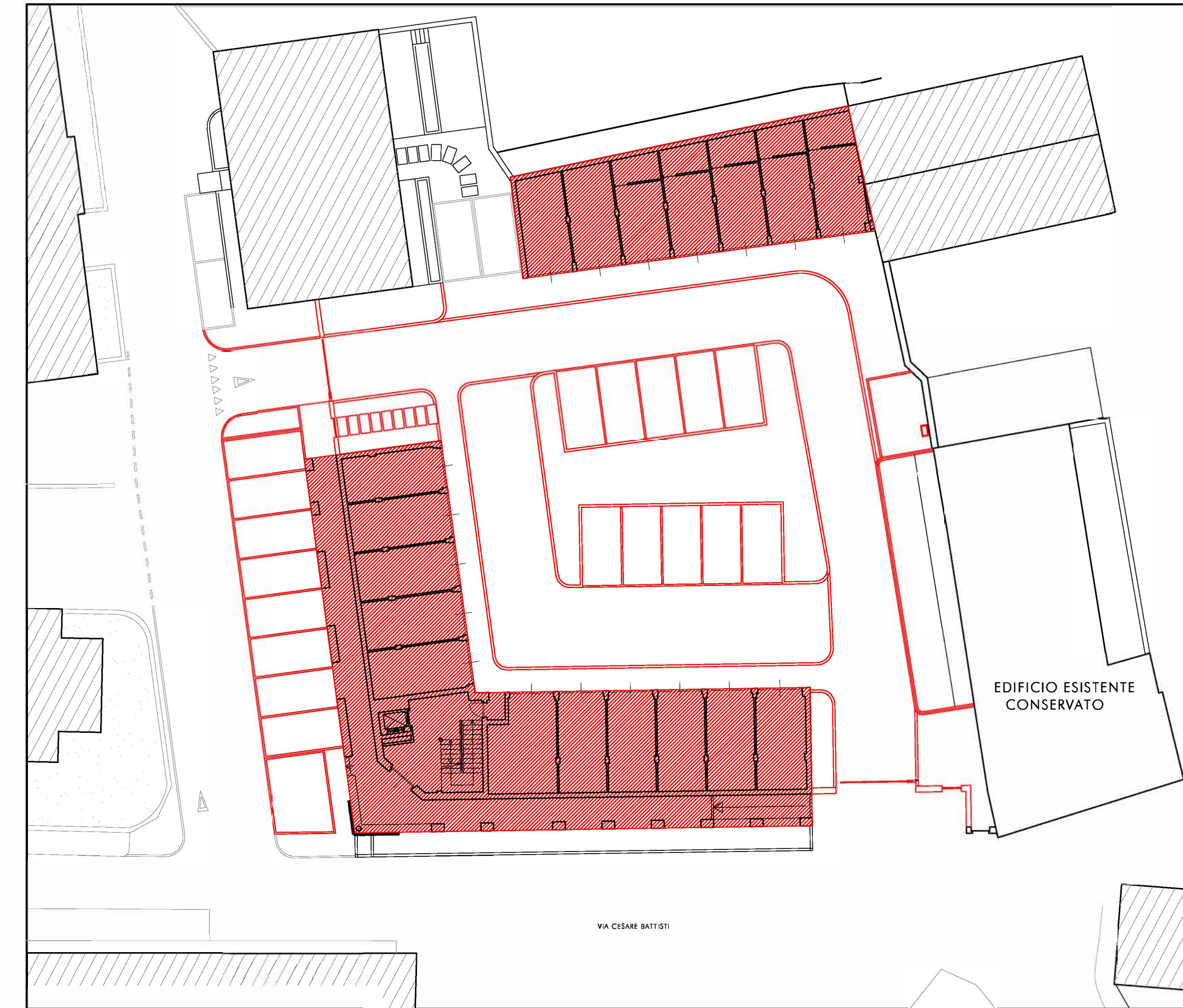
PLANIMETRIA DEL LOTTO SCALA 1 : 250 - NUOVE COSTRUZIONI