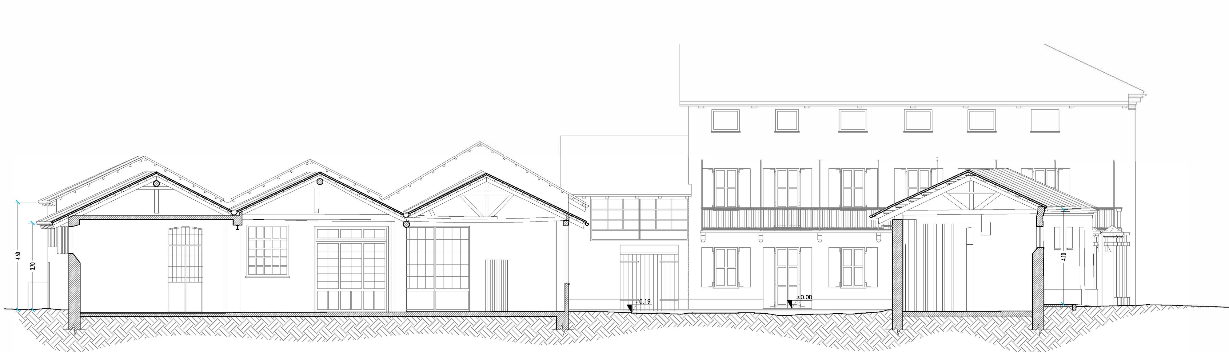
SEZIONE C - C