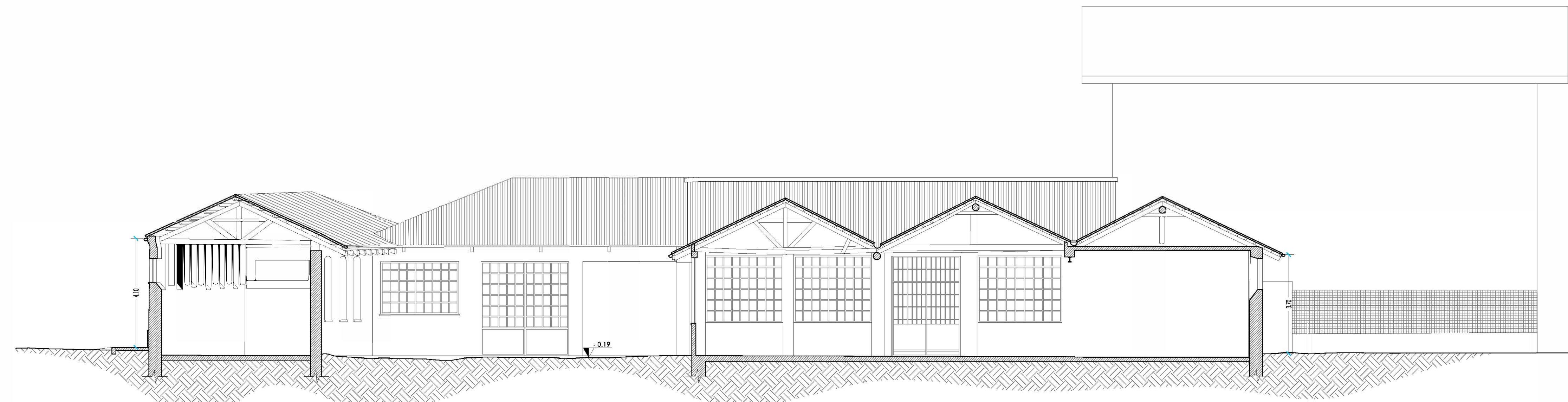
SEZIONE D - D