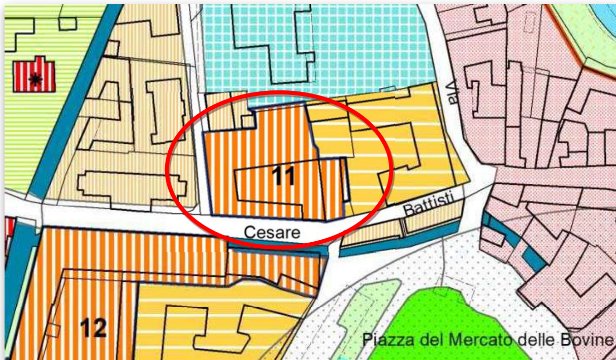
Estratto del Piano regolatore con individuazione del Piano di Recupero 11