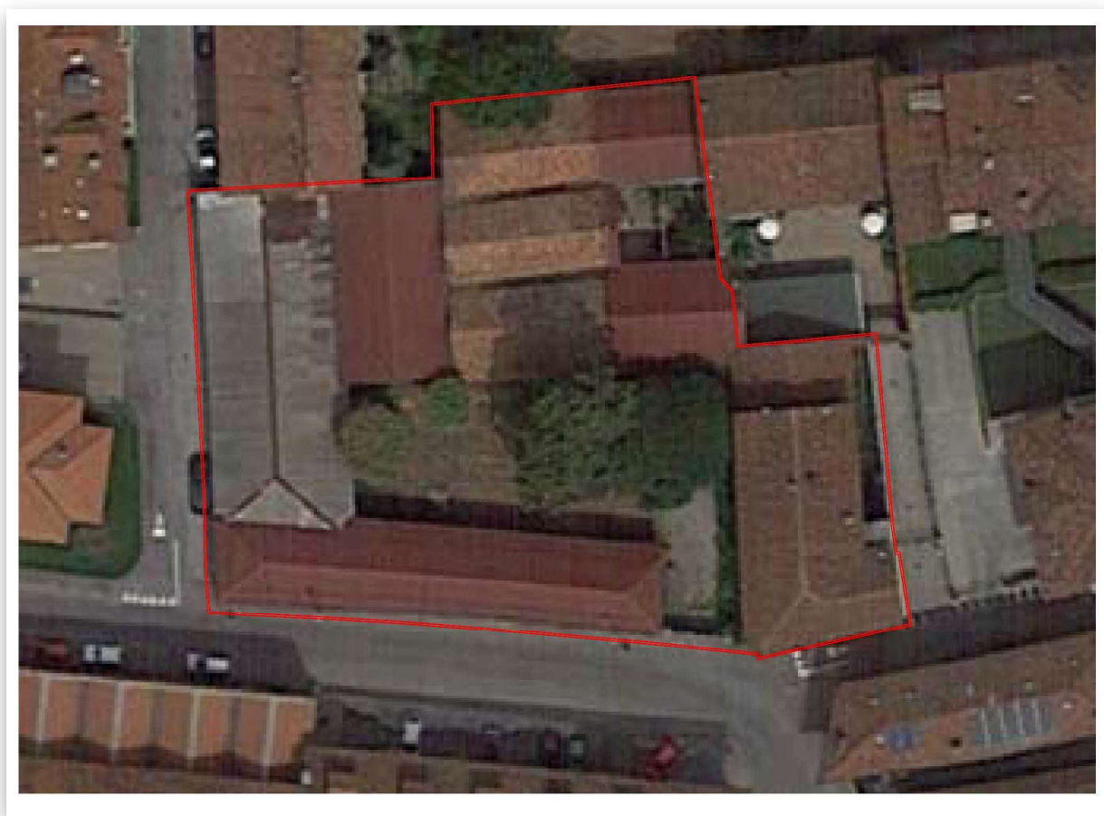
Immagine aerea con perimetrazione Area di Piano di Recupero n. 11

L'area si colloca lungo Via Cesare Battisti in area interclusa di mq. 1995 e completamente urbanizzata, confinante a nord con la scuola primaria "Einaudi" e con il condominio San Filippo, della medesima proprietà dei richiedenti il Piano di Recupero, a est con complesso residenziale di nuova costruzione (edificato con piano di recupero), a sud e ovest con Via Cesare Battisti.