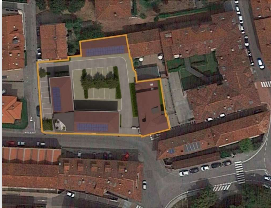
Foto inserimento in pianta del progetto di lottizzazione

Per la valutazione dell'intero progetto, delle opere di sistemazione dell'area pubblica, dell'importo dei lavori da realizzarsi e della valutazione degli oneri da versare si fa riferimento agli elaborati di progetto e relative relazioni di seguito sintetizzati: