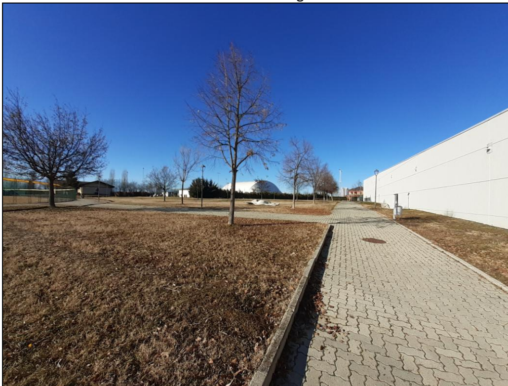
FOTO 2 vista su campi da tennis