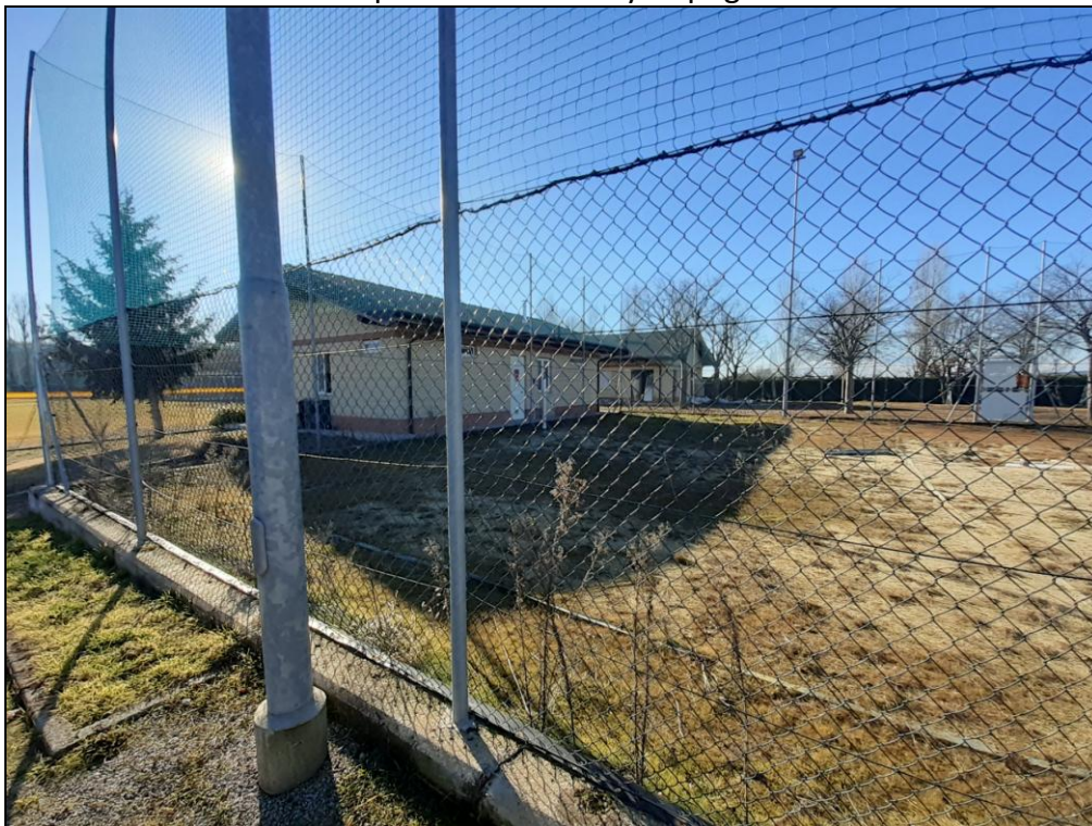
FOTO 4 vista su fabbricato uso bar/infermeria