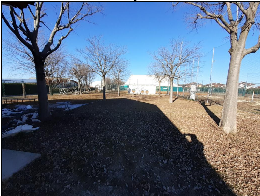
FOTO 6 vista su struttura spessostatica